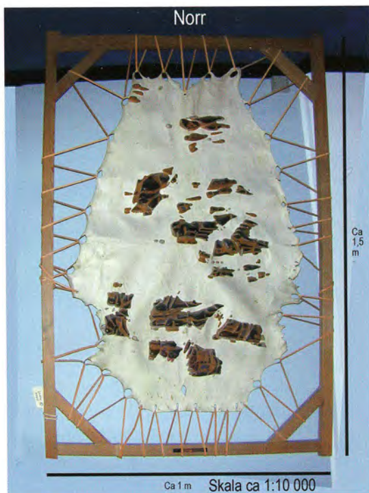
Fig 7 och 8

Till vänster nedtill två sjökort från Marshallöarna, gjorda av kokospalmens bladskaf, nu i Etnografiska museet.